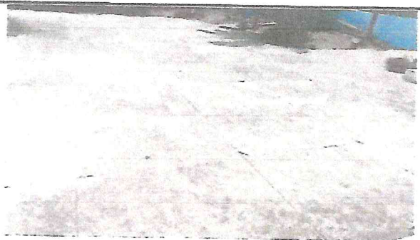
Foto 6: La cancha de basquetbol presenta deterioro en el cual ha provocado accidentes

Observación: Si es necesario se pueden agregar hojas adicionales y actualizar el número de hojas.