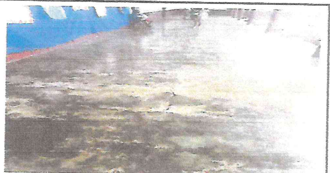
Foto 4: Torta de cemento presenta grietas en el area del corredor