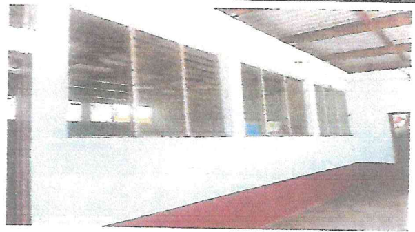
Foto 2: Presenta ventanas de vidrio lo cual ha provocado que personas ajenas a la escuela los quiebren e ingresen a los salones manchando el material didáctico