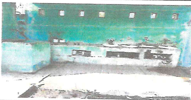
Foto 5: Labamanos deteriorados, en lo cual presenta fugas y grietas en la base de cemento.